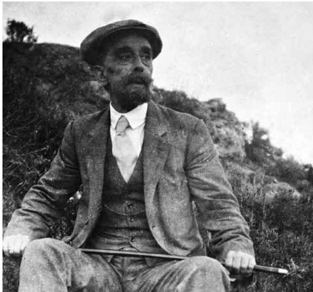
Joan Maragall i Gorina (Barcelona, 10 d'octubre de 1860 – 20 de desembre de 1911) poeta i escriptor, figura cabdal dins la poesia modernista del tombant de segle XIX-XX.

Membre de la intel·lectualitat culta de la Barcelona de la Renaixença, va fer una defensa de l'espontaneïtat i de la recerca de la simplicitat i arribà a desenvolupar la seva «teoria de la paraula viva». Més conegut per la poesia, va escriure també més de 450 textos en prosa, entre articles, assaigs, discursos, semblances biogràfiques i pròlegs. La seva activitat com a periodista al Diario de Barcelona i La Veu de Catalunya va tenir un important ressò.