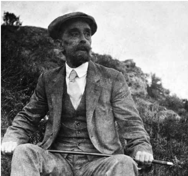
Joan Maragall i Gorina (Barcelona, 10 d'octubre de 1860 – 20 de desembre de 1911) poeta i escriptor, figura cabdal dins la poesia modernista del tombant de segle XIX-XX.

Membre de la intel·lectualitat culta de la Barcelona de la Renaixença, va fer una defensa de l'espontaneïtat i de la recerca de la simplicitat i arribà a desenvolupar la seva «teoria de la paraula viva». Més conegut per la poesia, va escriure també més de 450 textos en prosa, entre articles, assaigs, discursos, semblances biogràfiques i pròlegs. La seva activitat com a periodista al Diario de Barcelona i La Veu de Catalunya va tenir un important ressò.